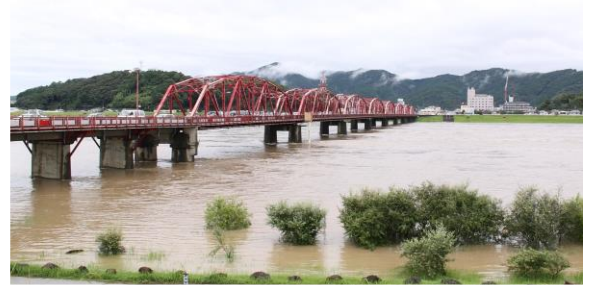
図1 四万十川の洪水時における観測状況

超音波ドップラー多層流向流速計(ADCP)を用いた河川における洪水流況や超音波技術を用いた土砂量計測技術の高精度化に関する研究・開発を行っている。